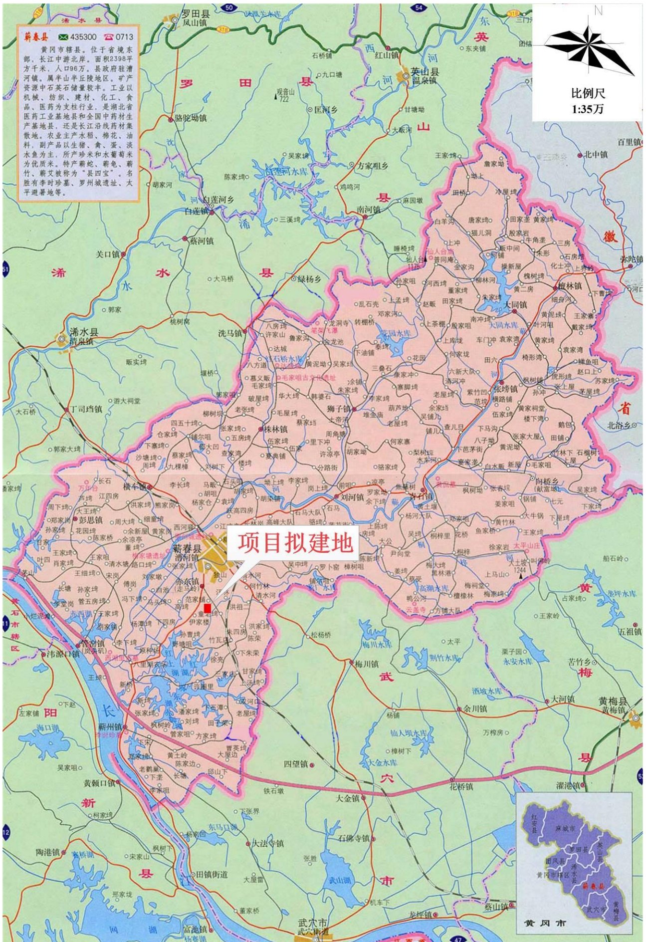
附图 1 项目地理位置示意图