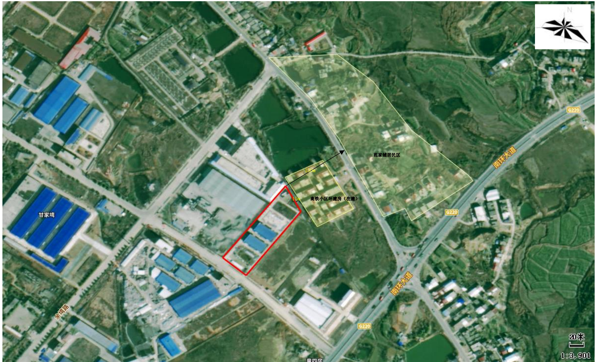
附图 2 项目周围环境示意图