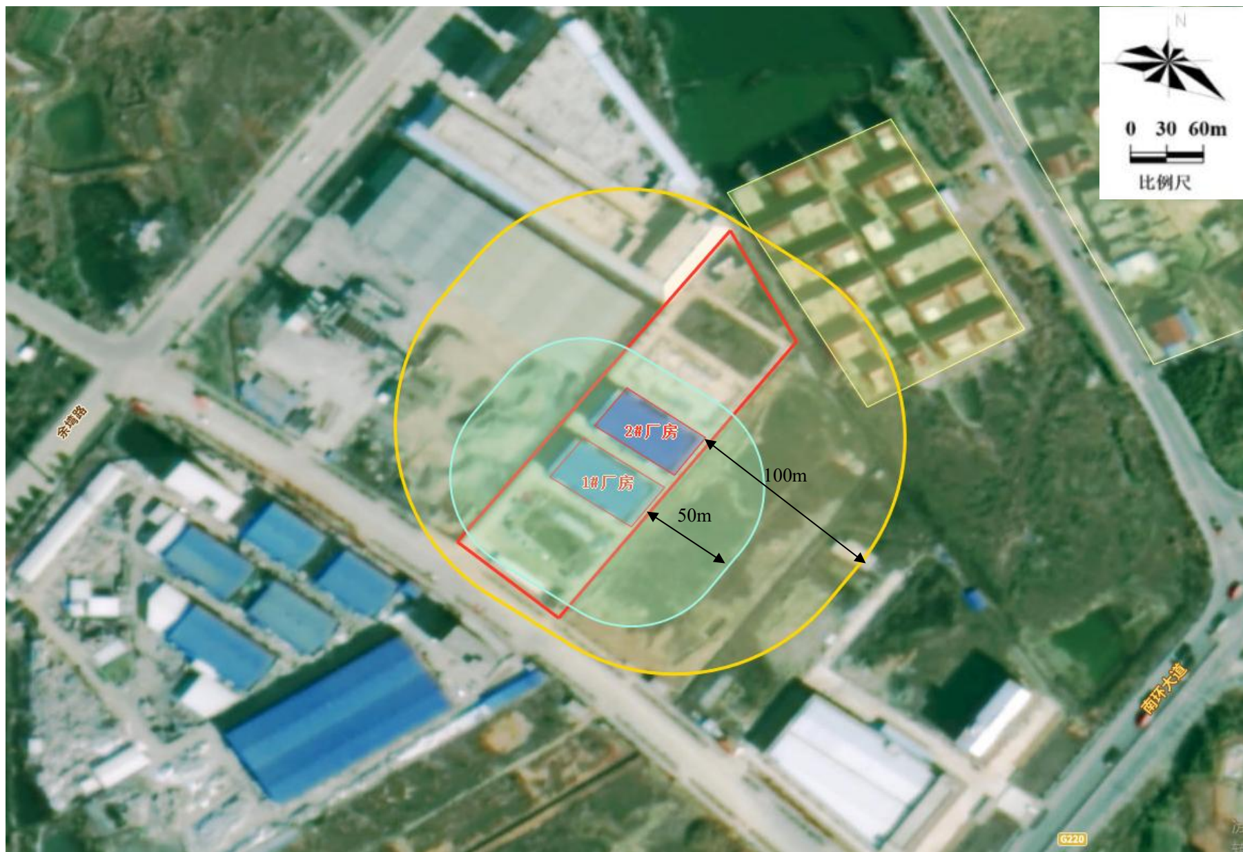
附图5 项目卫生防护距离包络线图